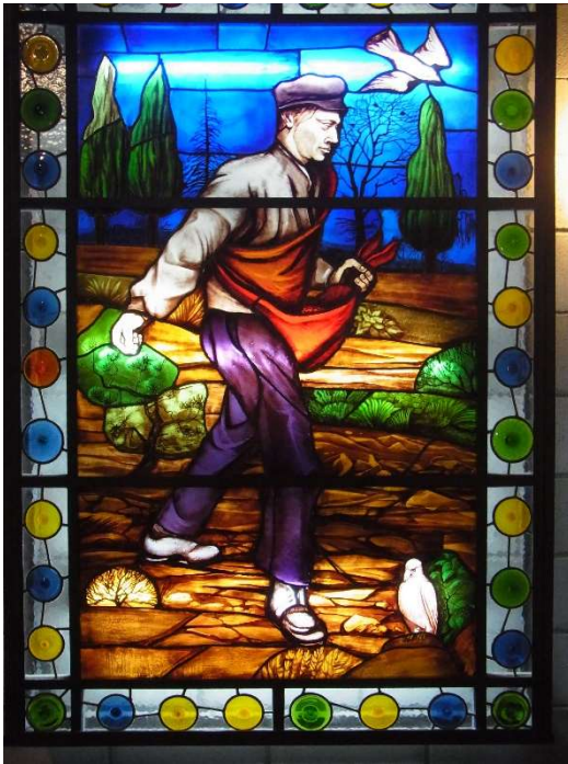
El sembrador , Ezeiza Argentinien

zur Tagung der Norddeutschen Hauptgruppen des Gustav- Adolf-Werks