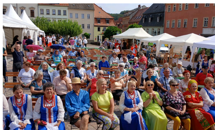
Blick auf den Marktplatz in Roßwein. Das Wetter meinte es gut mit Veranstaltern und Gästen.